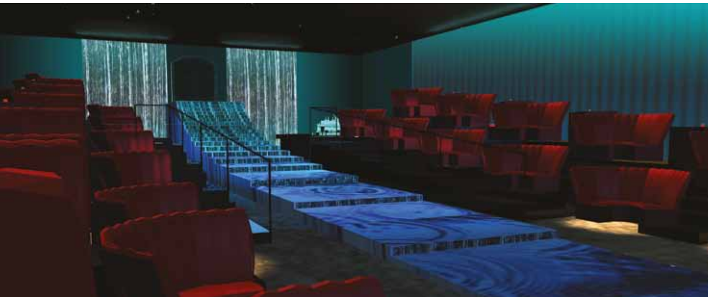
Immagine realizzata da Diana Kesselschmidt

Fate a pezzi i progetti complessi. Che voi siate un professionista unico che collabora con altri professionisti o una grande impresa che divide il lavoro tra i diversi membri del team, le potenti funzioni di lavoro di gruppo permettono di trattare in modo flessibile anche il più complicato dei progetti in parti facilmente gestibili.