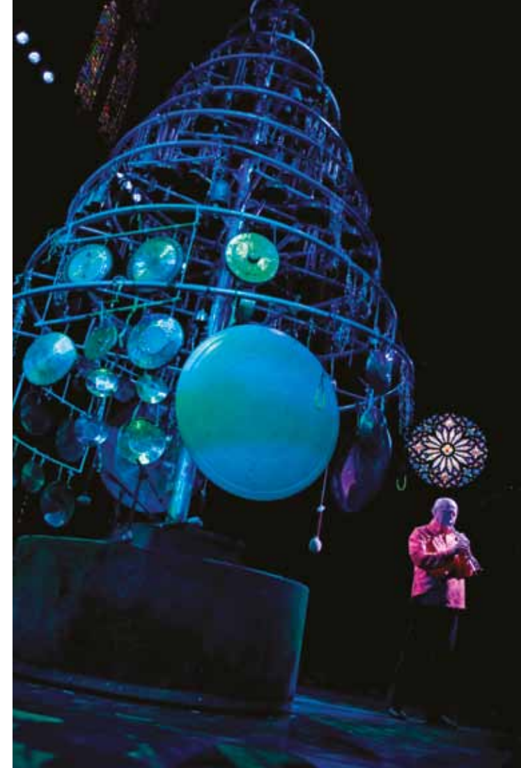
Immagine realizzata da Steve Shelley

Vectorworks Spotlight realizza le tue migliori ispirazioni